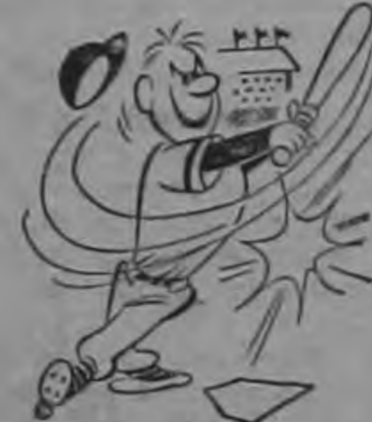
Mas tomó el grato Neuro Fosfato, y goza plena vitalidad!

Puntarenas y Alajuela, a las 11 horas en campo de Estadio de Alajuela.