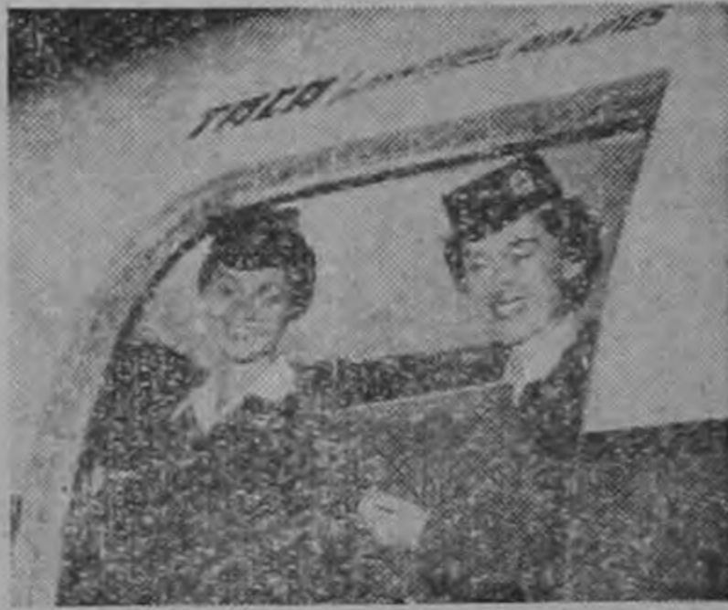
Dos señoritas encargadas del vuelo, atentas a sus necesidades, estarán siempre a su servicio.