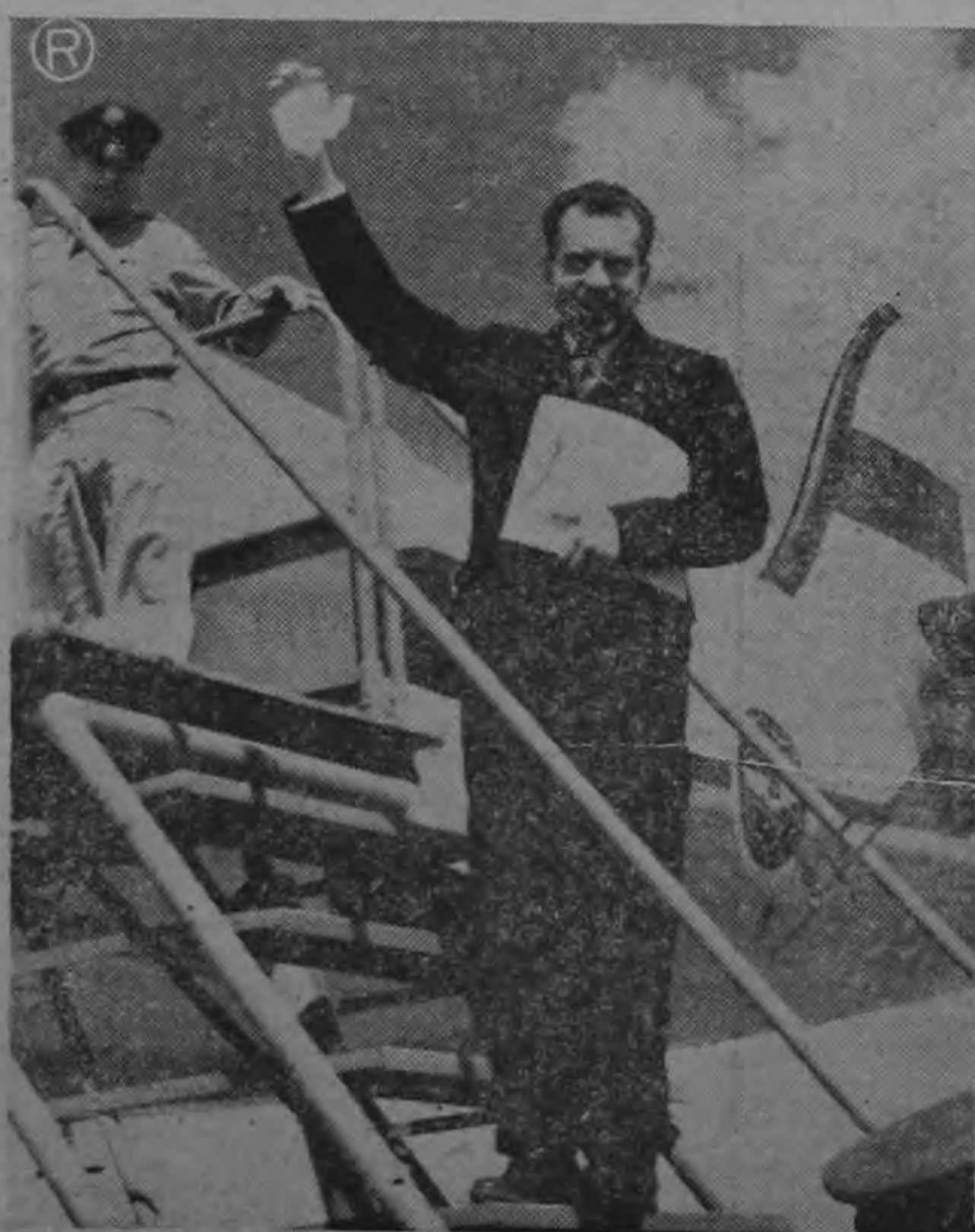
Mr. Richard Nixon, Vice Presidente de los Estados Unidos, en el momento en que en el aeropuerto, de El Coco se despedía