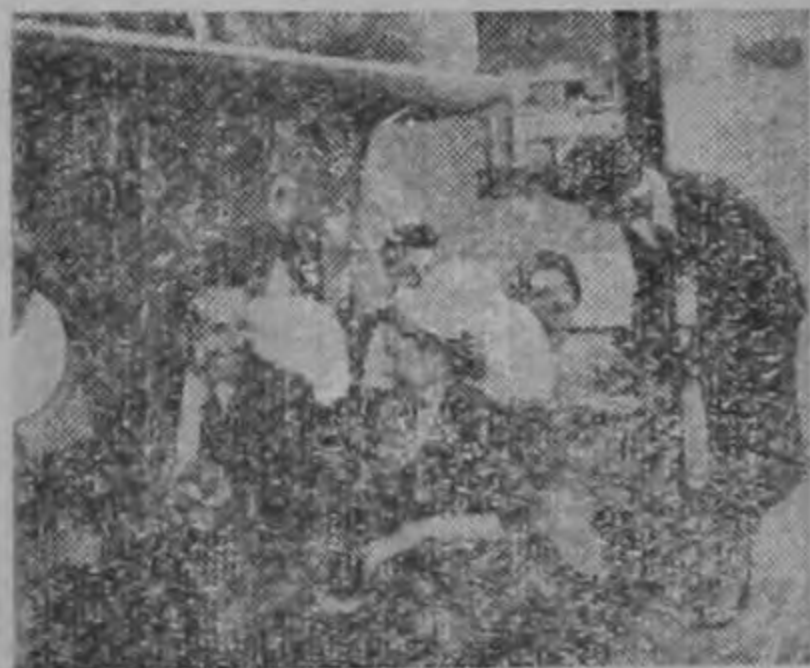
Su comodidad es primero. Asientos siempre solo dos de frente.