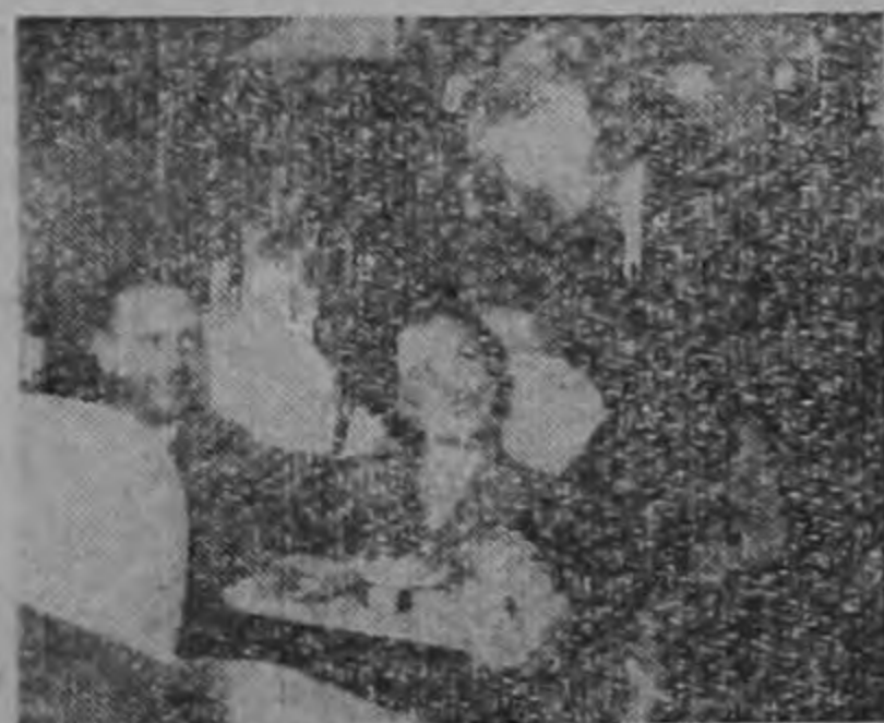
Cocina Continental a bordo para tentar su apetito. Servicio de Cantina.