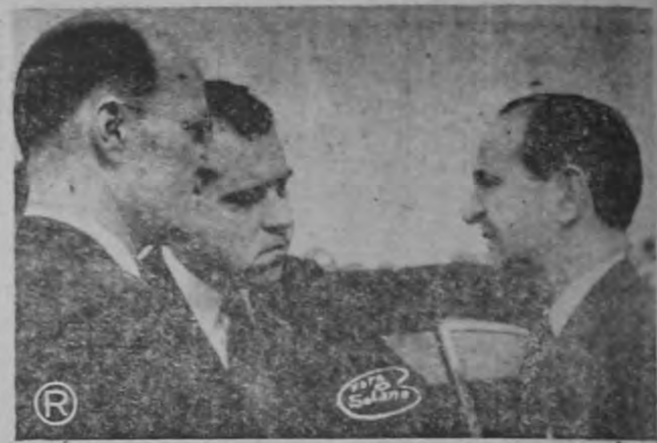
Mr. Nixon y Mr. Holland, conversan animadamente, en un aparte, momentos antes de partir hacia Panamá, para dar cumplimiento a la labor de acercamiento y de buena voluntad que con tanto acierto están llevando a efecto por nuestro istmo y el Caribe.

El salón en donde se especifica maravillosamente el curso de la evolución de la vida y que incluye la transformación y emigración de los animales de mar hacia la tierra sorprende por su claridad. Valiosa la explicación que hay del origen del hombre como procedente del mono. Los gigantescos esqueletos que hay aquí, como material auxiliar a las explicaciones de estos asuntos ocupan toda una sala. Lugar preferente ocupa el salón que tiene la colección de esculturas y pintura de esta institución. Existe aquí una maravillosa colección de pinturas de artistas venecianos y florentinos del siglo catorce. También los hay de otros países y especialmente de la Francia dieciochesca, incluyendo pintores norteamericanos del siglo diecinueve. Los interesantes cuadros religiosos de la Virgen y el Niño, de San Juan Bautista, de Rembrandt; de las madonas de los famosos cuadros de Rubens y de Van Dyck, así como también las representaciones de Gauguin, Lautrec y Picasso, constituyen verdaderos motivos de honda cultura.