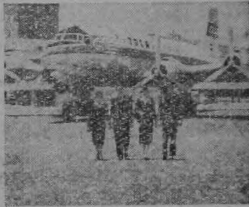
Equipo lujoso Douglas de 4 motores Sky-master.

Vuele TACA y este seguro de: Itinerarios Convenientes Servicio Lujoso Excelentes Conexiones