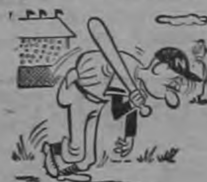
Era el más flojo, más indolente: era una gran calamidad...

TERCERAS DIVISIONES. Carmen y Uruguay a las 10.30 horas en campo de Coronado. Municipal-La Uruca, a las 10 y 30 horas en campo de La Uruca.